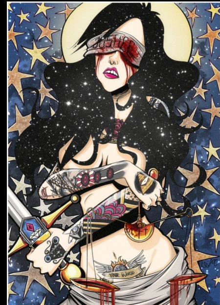
Justice Woman, Por Eliz0r