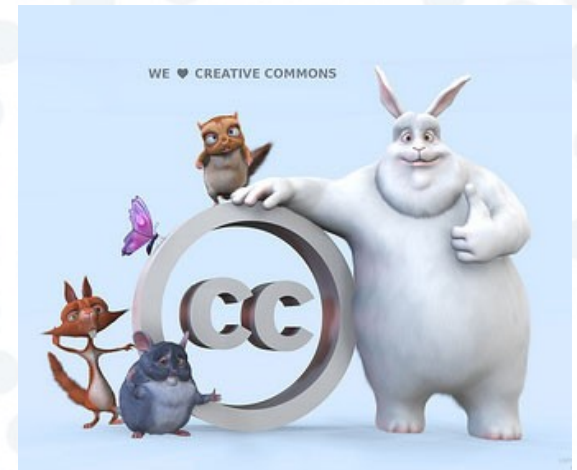
Creative Commons BBB, por steren.giannini